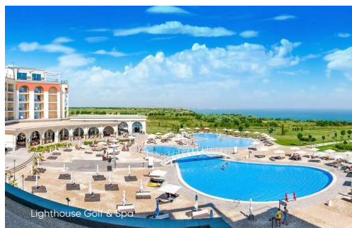
Lighthouse Golf & Spa